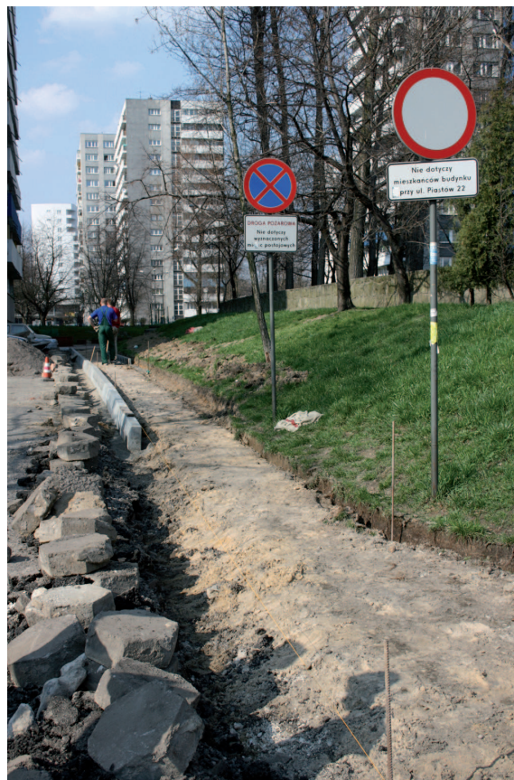
Remontowany podjazd przy ul. Piastów 22