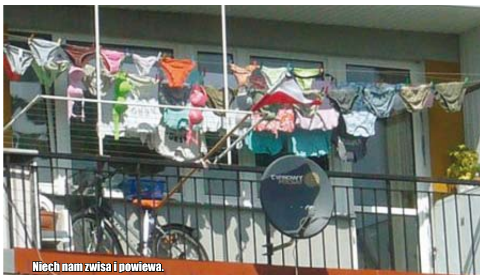
Niech nam zwisa i powiewa.

Większość z nas słyszała o porządku domowym albo o regulaminie porządku domowego . Ale nie każdy wie,