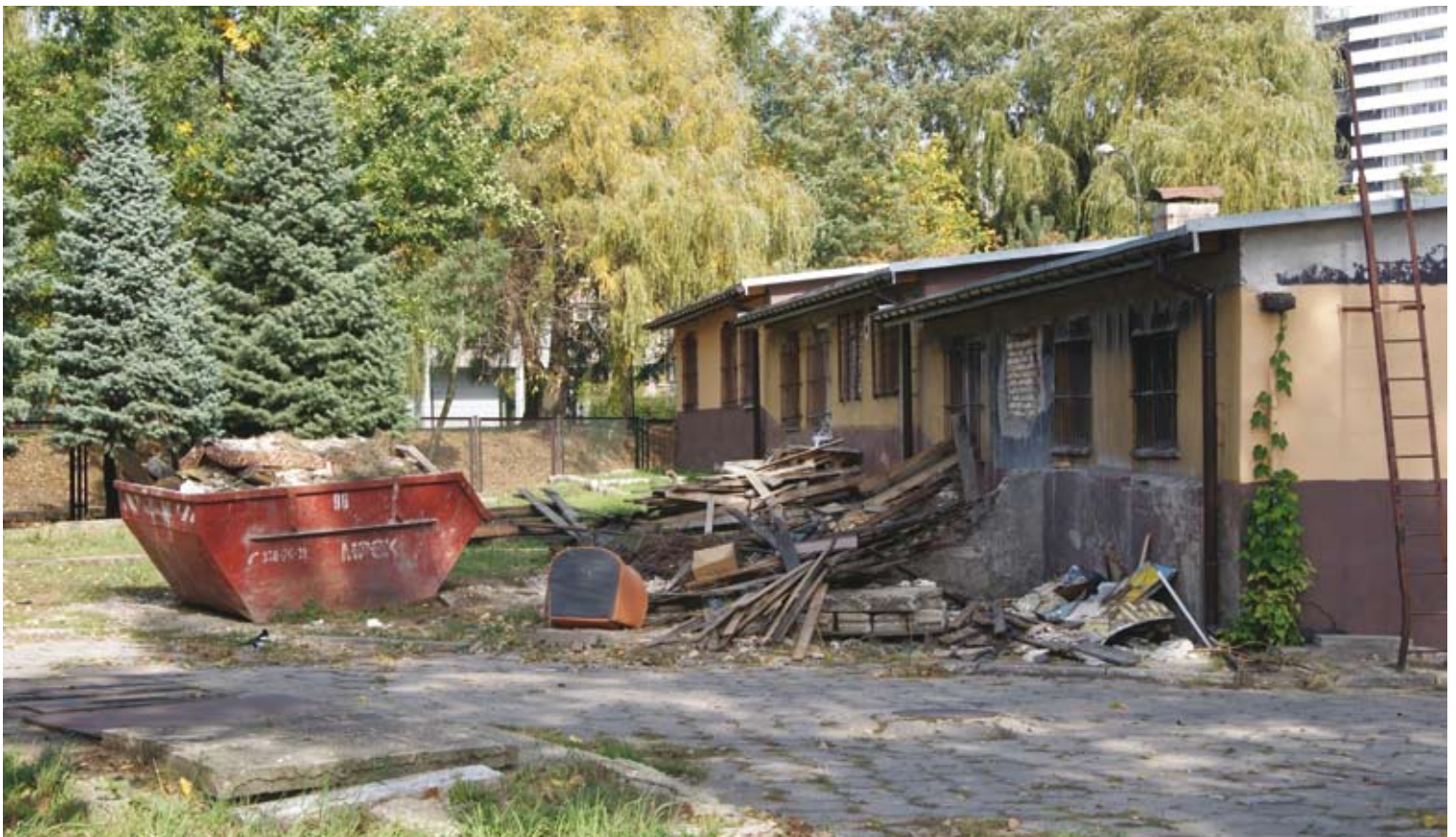
Było co sprzątać!

– pismo SM Piast do UM Katowice, podtrzymujące stanowisko Spółdzielni