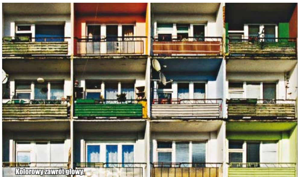
Kolorowy zawrót głowy.

Warto w tym miejscu wspomnieć jeszcze o jednej sprawie. O ile postanowienia regulaminu odnoszące się do naszego bezpieczeństwa lub postanowienia z zakresu sanitarno-higienicznego traktujemy (ogólnie jako społeczność) w sposób odpowiedzialny, o tyle do postanowień, które „osobiście nie są nam na rękę”, odnosimy się z dużą rezerwą (żeby nie powiedzieć ignorancją). To „zjawisko” dotyczy przed wszystkim: