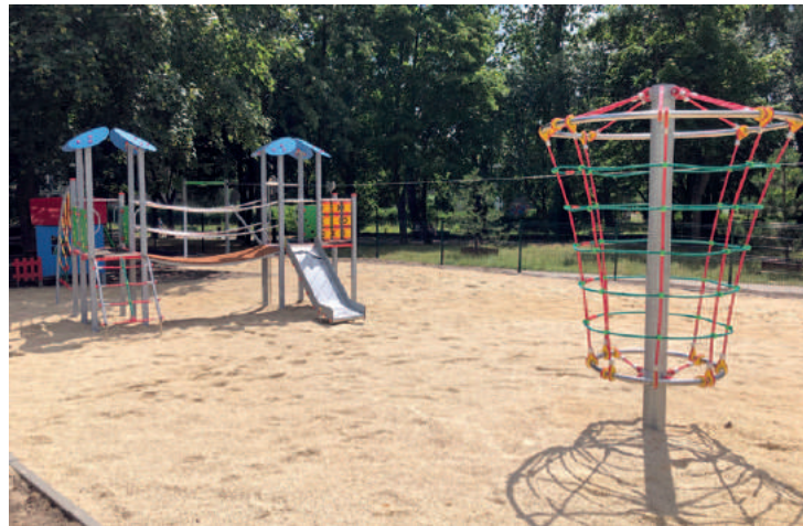
Plac zabaw na ul. Tysiąclecia 7

Budowa nowego placu zabaw przy ul. Tysiąclecia 7 trwa w najlepsze, ku uciesze dzieci oraz rodziców, którzy obserwując pojawiające się nowe urządzenia, nie mogą doczekać się