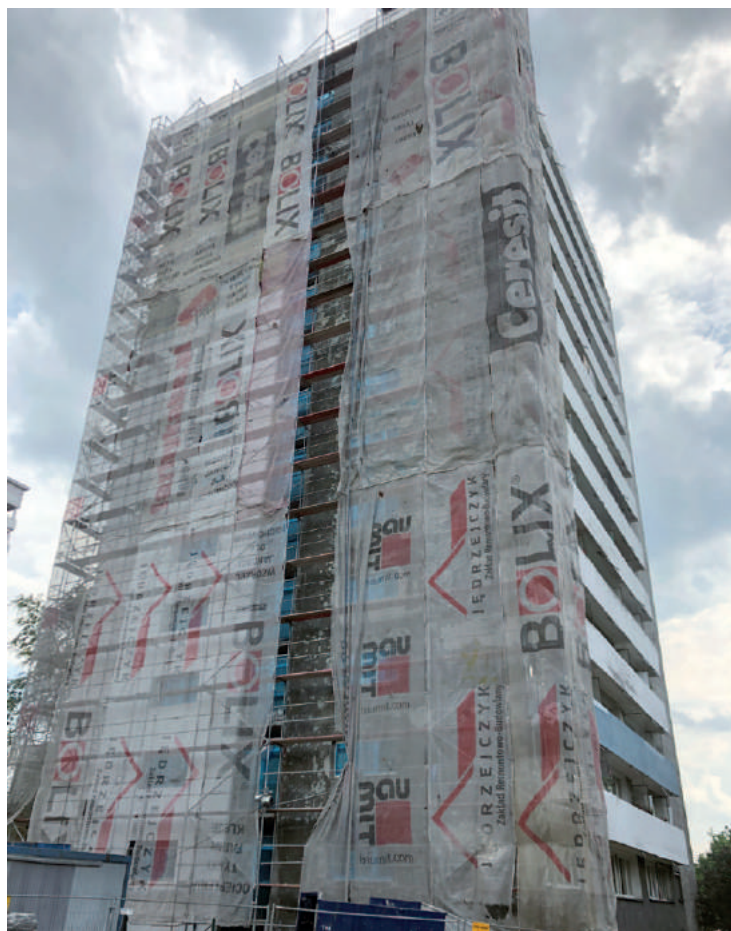
Termomodernizacja bloku na ul. Piastów 10

Rozpoczęto już termomodernizację budynków Chrobrego 37, Piastów 10, a także zawarto umowę na termomodernizację budynku Tysiąclecia 47, która wykonywana będzie po zakończeniu prac na budynku Piastów 10.