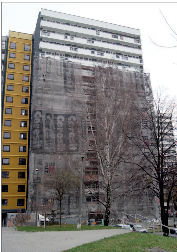
Bolesława Chrobrego 43

Obecnie opracowywane są plany remontowe i inwestycyjne na rok 2022, które pozwolą na dalszą poprawę wizerunku naszego osiedla i utrzymanie w odpowiednim stanie technicznym wszystkich budynków oraz jego rozwój.