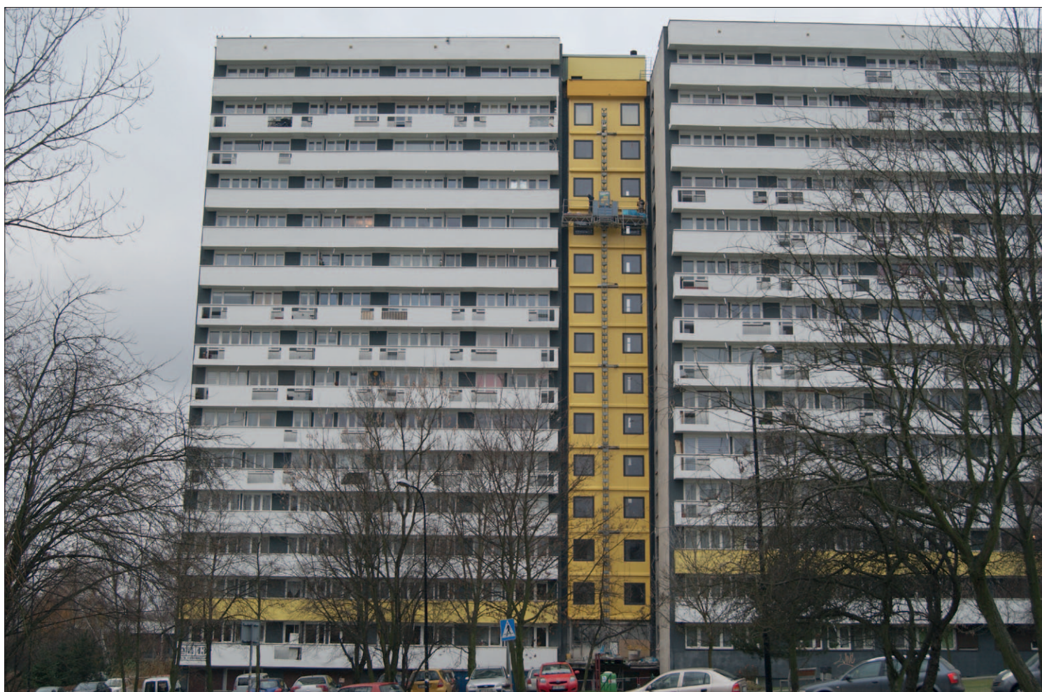
Bolesława Chrobrego 43