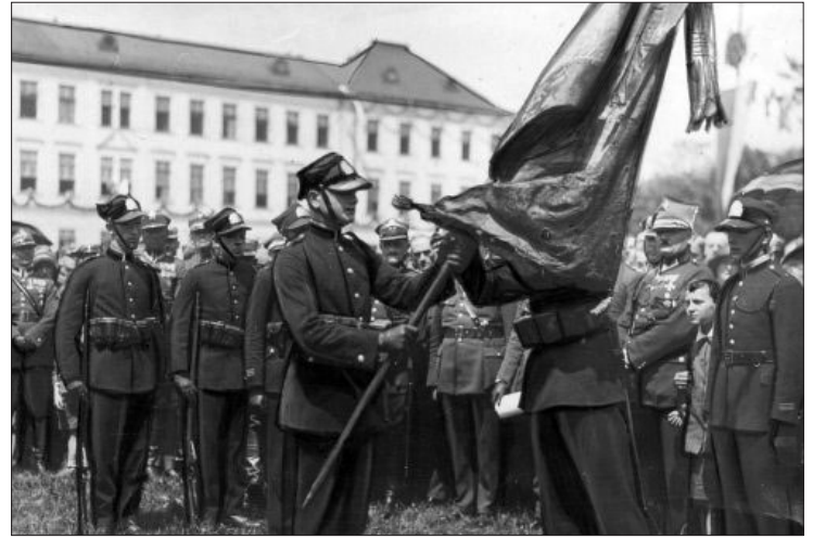
Dekoracja sztandaru Korpusu Kadetów nr 1 we Lwowie Śląskim Krzyżem Zasługi, wrzesień 1931 r.

W walkach na Śląsku wzięło udział około 70 kadetów. (Według dokumentu Centralnego Archiwum Wojskowego udostępnionego dla PAP w lipcu 2016 r. raport sporządzony w 1921 roku dla Ministerstwa Spraw Wojskowych mówi o ponad 100 kadetach uczestniczących w walkach). Spotykamy ich imiona niemal w każdej grupie powstańczej, niemal w każdym oddziale.