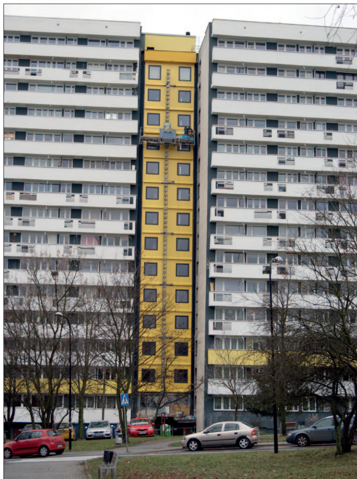
Bolesława Chrobrego 43