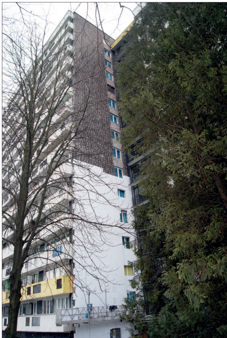
Bolesława Chrobrego 37