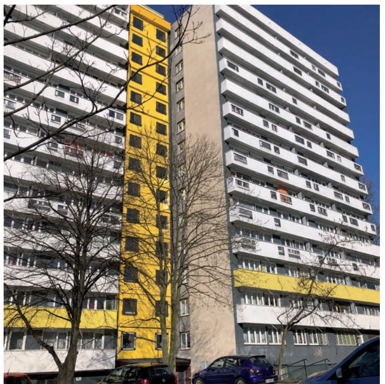
Przebudowa ścian osłonowych głównego ciągu komunikacyjnego budynku Chrobrego 43