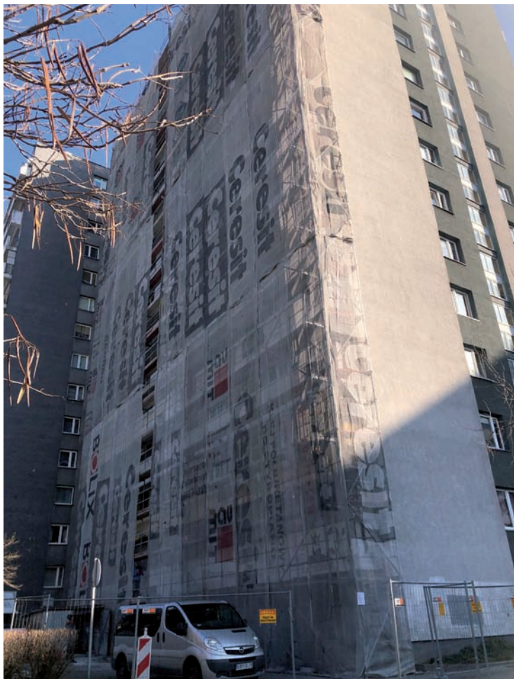
Remont elewacji budynku Chrobrego 31 – segment garażowy strona zachodnia