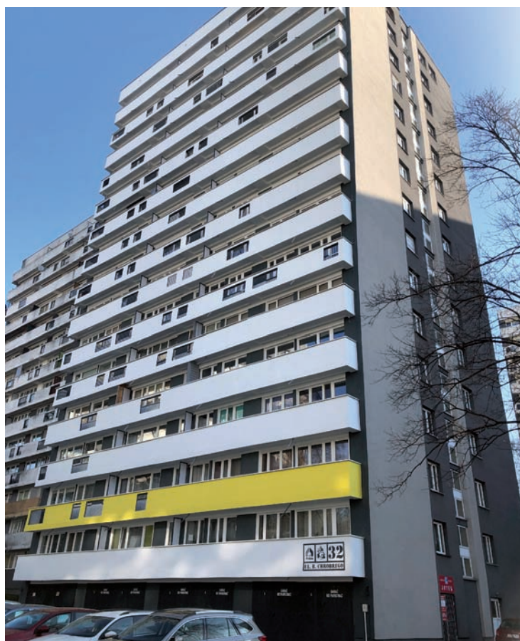
Zakończony remont elewacji budynku Chrobrego 32 – segment garażowy strona zachodnia

oraz likwidacja odwadniaczy podpionowych w segmencie garażowym.