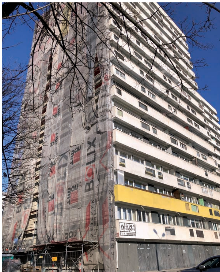
Ocieplenie północnej ściany szczytowej budynku Chrobrego 37