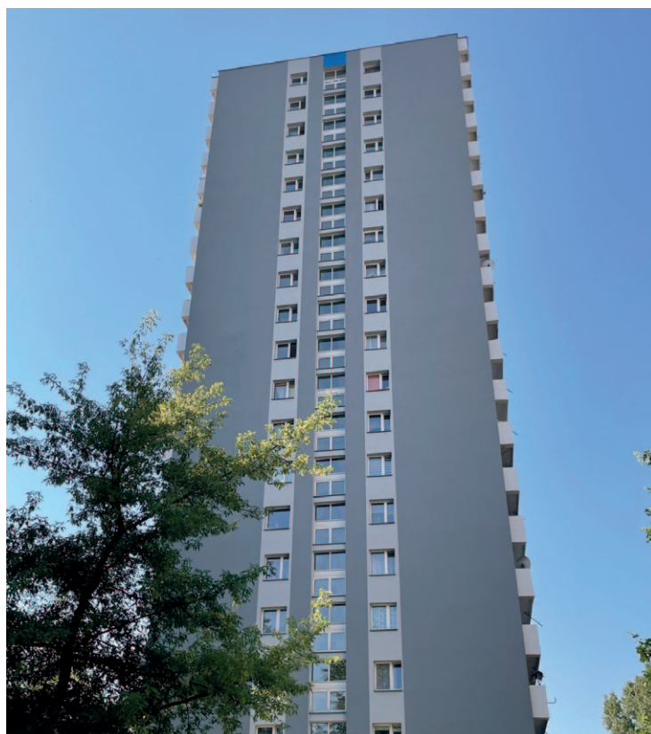
Piastów 9 - termomodernizacja północnej ściany szczytowej