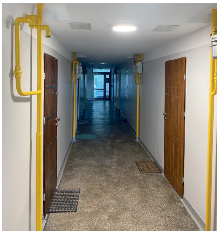
Piastów 26 - wyremontowany korytarz lokatorski