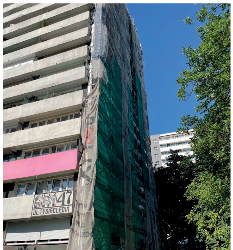
Tysiąclecia 47 - termomodernizacja północnej ściany szczytowej