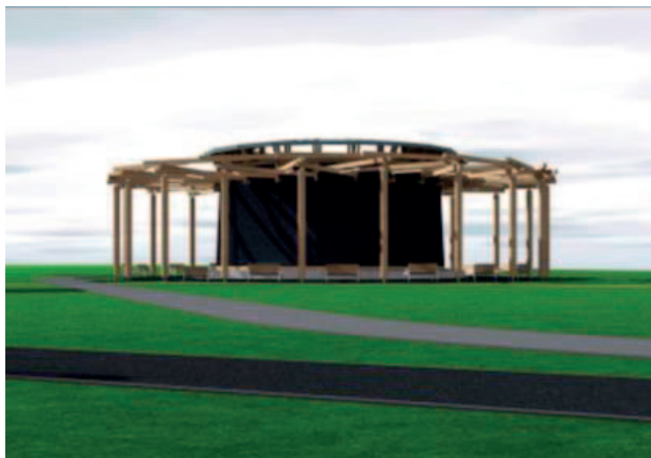
Fot.: Projekt koncepcyjny tężni wykonany przez firmę Asa Stożek Architekci, marzec 2021 r.

W lutym 2021 roku Urząd Miasta zawarł umowę na wykonanie dokumentacji projektowej. W grudniu 2021 roku Zakład Zieleni Miejskiej ogłosił pierwszy przetarg na realizację robót zgodnie z opracowaną dokumentacją projektową. Niestety, Urząd Miasta przetargu nie rozstrzygnął, gdyż wszystkie złożone oferty przekraczały kosztorys inwestorski, czyli kwotę, jaką Miasto zabez-