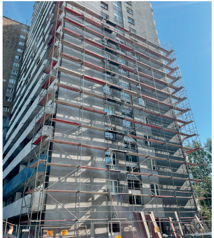
Piastów 9 - termomodernizacja południowej ściany szczytowej